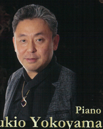
Piano Yukio Yokoyama ピアノ 横山幸雄