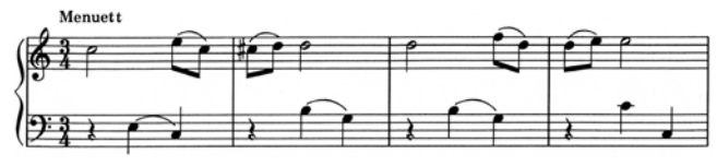
出典楽譜：モーツァルト幼年時代の作品集/ロンドンの楽譜帳 (全音)

「モーツァルト幼年時代の作品集/ロンドンの楽譜帳」(全音) 古典期名曲集(全音)ほか メヌエット ハ長調