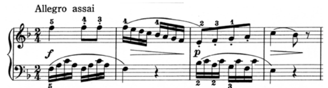
出典楽譜：ソナチネアルバム2 (全音)