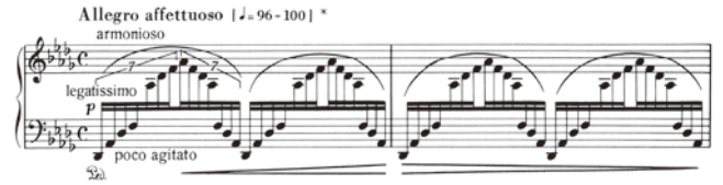
出典楽譜：リスト ピアノ作品集1 (ムジカ・ブタベスト)