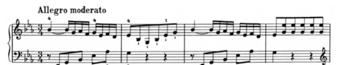
出典楽譜：ハイドン ピアノソナタ全集 (ウィーン原典)