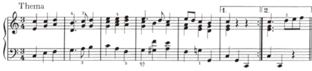
出典楽譜：ベートーヴェン 変奏曲集 第2巻 (ヘンレ)