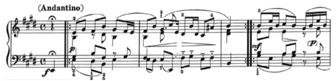
出典楽譜：ヘンデル集 (春秋社)