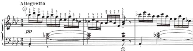
出典楽譜：シューベルト 即興曲 / 楽興の時 (ヘンレ)