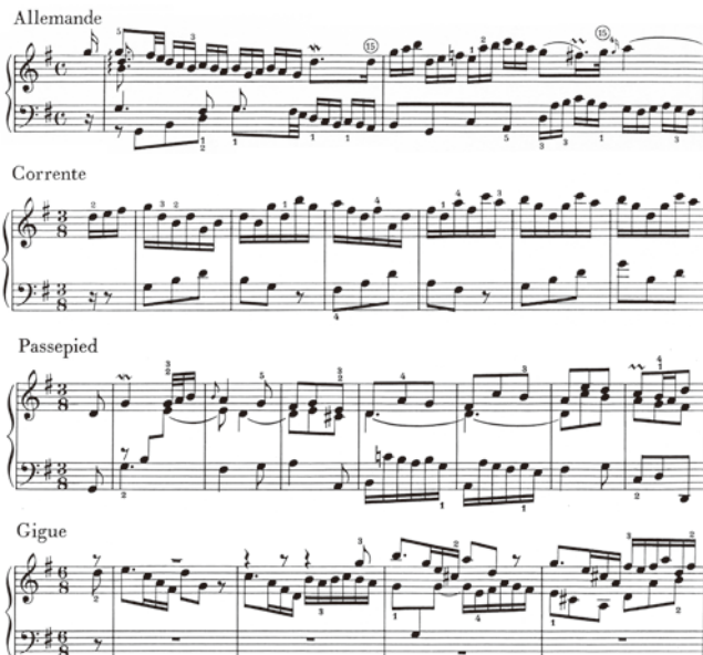
出典楽譜：バッハ 6つのパルティータ (ヘンレ)