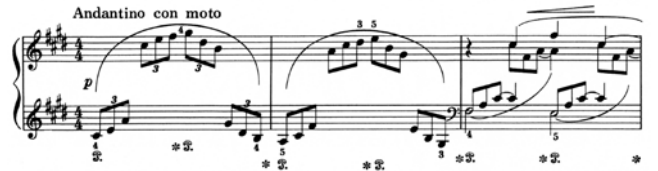
出典楽譜：ドビュッシー ピアノ曲集1 (音友)