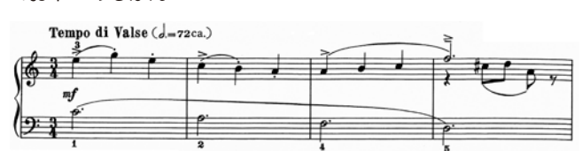
出典楽譜：こどものせかい (カワイ)