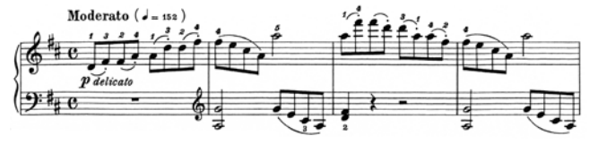
出典楽譜：ブルクミュラー 25の練習曲 (音友)