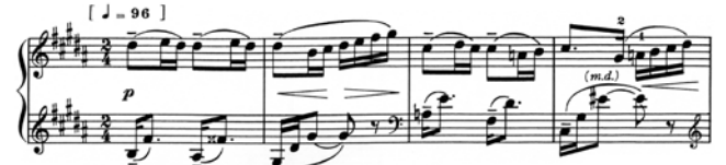
出典楽譜：三善晃 海の日記帳 (音友)