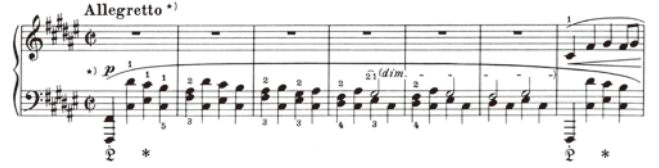
出典楽譜：ショパン 即興曲集 (ウィーン原典)