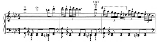
出典楽譜：ショパン ポロネーズ集 (ウィーン原典)