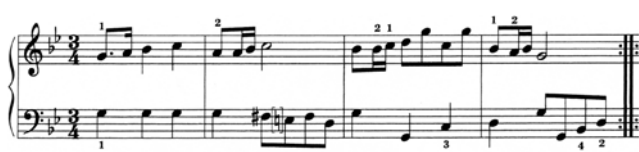
出典楽譜：バッハ アンナ・マクダレーナのためのクラヴィーア小曲集 (音友)

「バッハ アンナ・マクダレーナのためのクラヴィーア小曲集」各社版 ポロネーズ ト短調