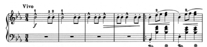
出典楽譜：ショパン ワルツ集 (全音)