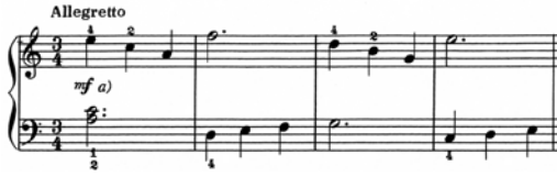
出典楽譜：バロック・アルバム1 36の小品集 (音友)