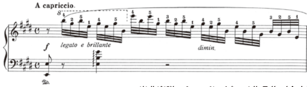
出典楽譜：ショパン ピアノ作品集 (全音)