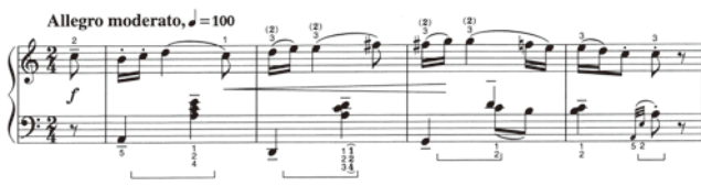
出典楽譜：バルトーク ピアノ作品集 (音友)