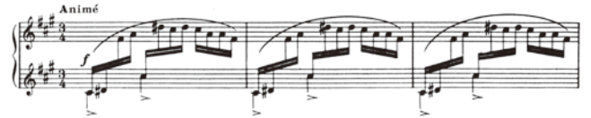
出典楽譜：ラヴェル ピアノ作品集 第1巻 (ヤマハ)