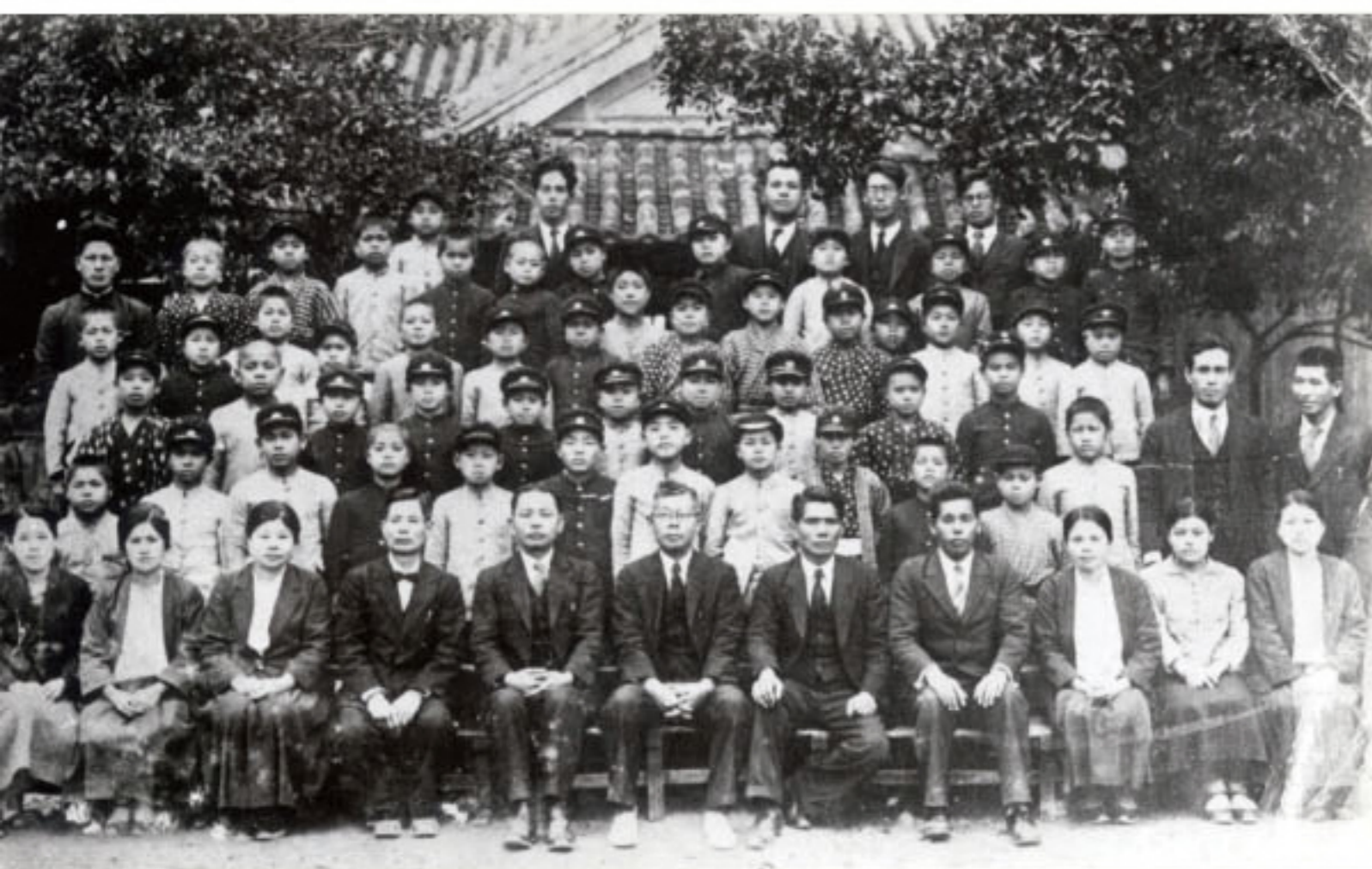
久茂地小学校 職員と生徒