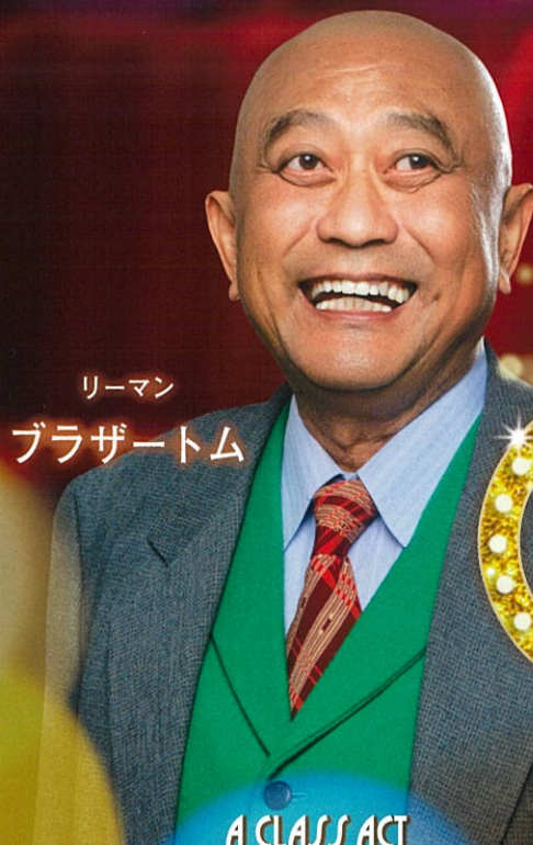
リーマン ブラザートム