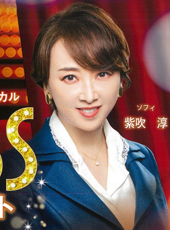
ソフィ 紫吹 淳