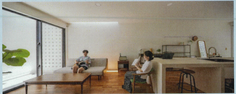
上段左「風と生きる花ブロックの家」 上段右「衣食住創～育む家～」 下段「ミニマルマキシマル」

今年度の講演会は、市民の皆さんに沖縄の気候風土にあった省エネ住宅についてお話しします。エネルギーを賢く使う住まい方が、どのように暮らしを変えるのかをわかりやすく解説し、沖縄ならではの省エネ基準の進化の物語を紐解きます。そして、亜熱帯気候に最適な住宅デザインと驚きの省エネ実例を紹介するとともに、近未来の沖縄の住まいを明るい視点から展望します。皆さんにも知ってほしい沖縄における新しい住まい方についての講演会です。