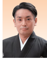
笛 入嵩西 諭